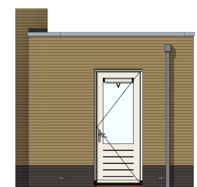
AG5021 - Enkele loopdeur in achtergevel gespouwde zijaanbouw