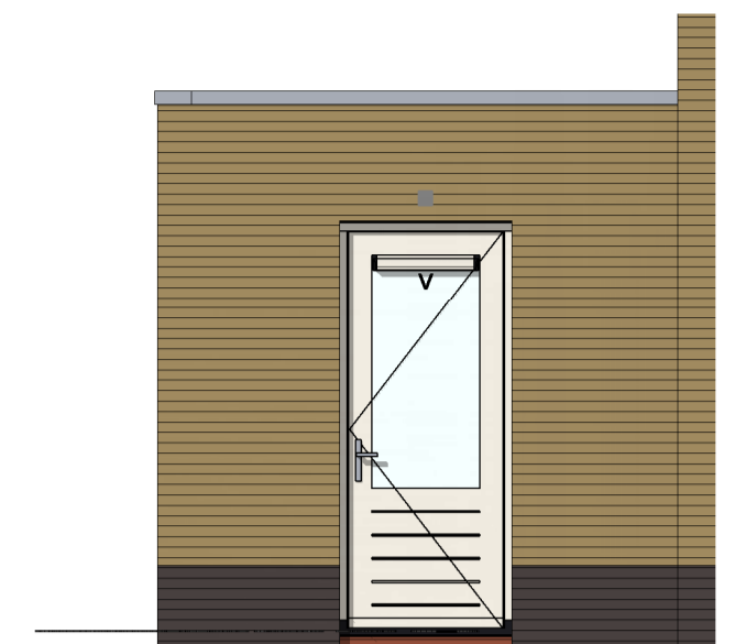
VG5026 - Enkele loopdeur in voorgevel gespouwde zijaanbouw voorzien van matglas