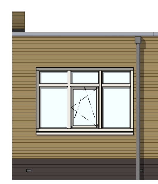
AG5024 - Kozijn met gemetselde borstwering in achtergevel zijaanbouw