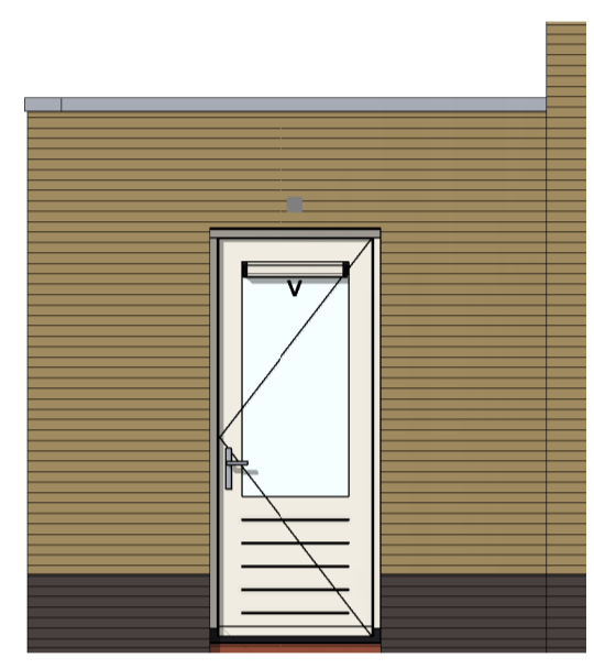
VG5026 - Enkele loopdeur in voorgevel gespouwd zijaanbouw voorzien van matglas