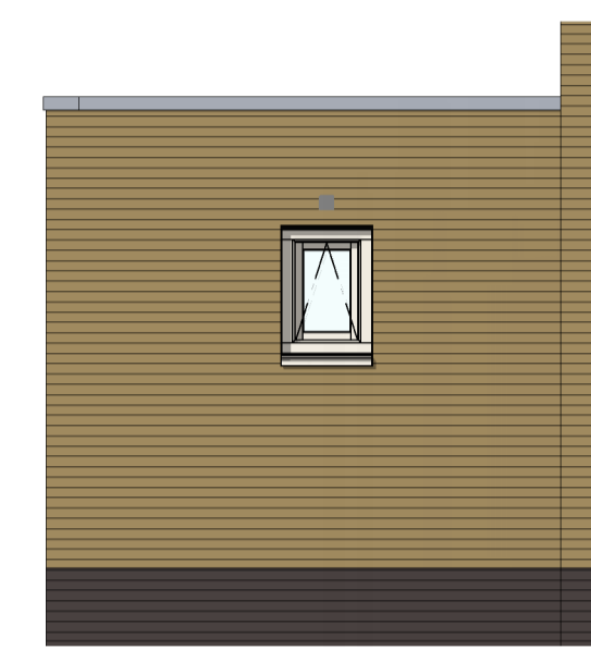
VG5031 - Badkamerraam in voorgevel zijaanbouw