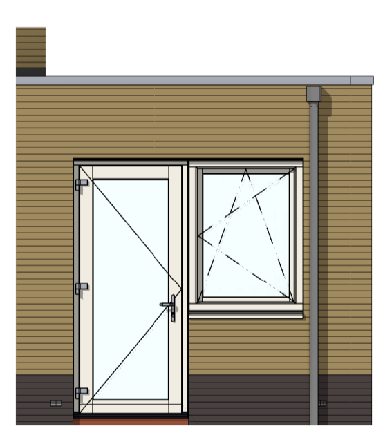
AG5025 - Enkele loopdeur en raam met gemetselde borstwering in achtergevel zijaanbouw